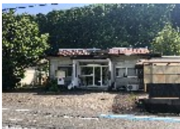
第二学而寮 学校まで約1km！