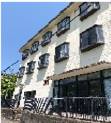
第一学而寮 学校に直結！