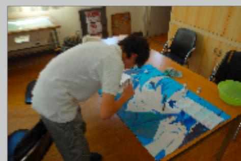
陶芸、木工、和紙づくり 等