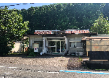
第二学而寮 学校まで約1km！