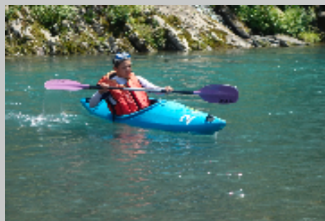
カヌー、MTB、トレッキング、ボルダリング 等