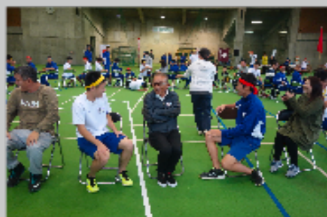
地域の文化祭（翔龍祭）、地域の祭り、清掃作業 等